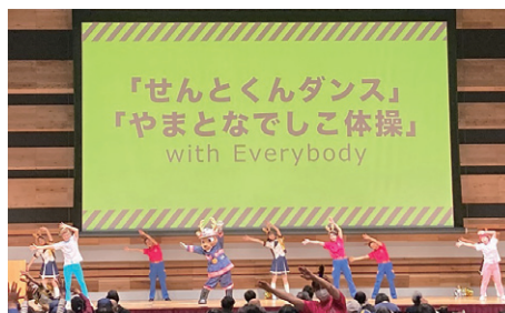
やまとなでしこ体操