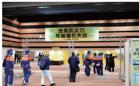
防災用品展示 (パネル展示)