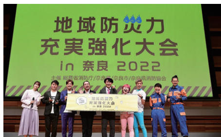
フォトセッション